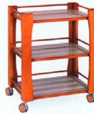
Cod. 700/13 Carrello a tre ripiani