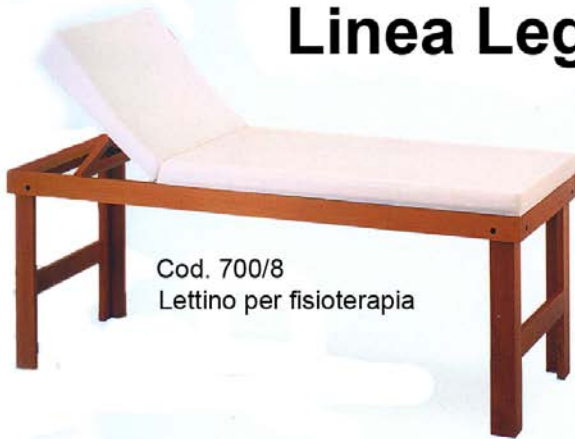
Cod. 700/8 Lettino per fisioterapia

Letti e complementi d'arredo con struttura in legno massello di faggio slavo verniciato e lucidato