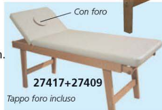
Tappo foro incluso