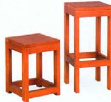
Cod. 700/19B - 700/19A Sgabelli