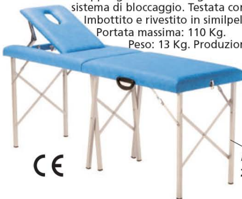
27406 Dimensioni: 62x182 cm

Leggero, pieghevole, due sezioni, lettino da visita con telaio in alluminio. Le doppie gambe centrali garantiscono stabilità e sistema di bloccaggio. Testata con foro naso-bocca. Imbottito e rivestito in similpelle. Portata massima: 110 Kg. Peso: 13 Kg. Produzione Italiana.