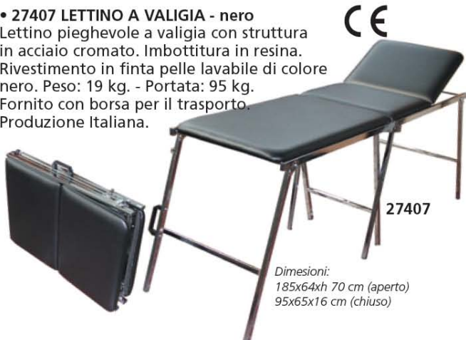
27407 Dimensioni: 185x64xh 70 cm (aperto) 95x65x16 cm (chiuso)

Lettno pieghevole a valigia con struttura in acciaio cromato. Imbottitura in resina. Rivestimento in finta pelle lavabile di colore nero. Peso: 19 kg. - Portata: 95 kg. Fornito con borsa per il trasporto. Produzione Italiana.