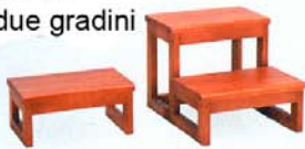
Cod. 700/51 - 700/52 Predellini a uno e due gradini