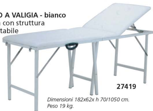
27419 Dimensioni 182x62x h 70/1050 cm. Peso 19 kg.

Lettno a valigia con struttura estremamente stabile in alluminio verniciato e materassino skay colore bianco.