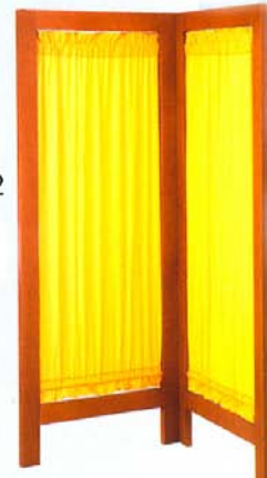
Cod. 700/42 Paravento a due ante